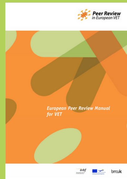
European Peer Review Manual for VET, 2009

Transnacionalna kolegijalna procjena počiva na metodologiji Peer Review -a koja je opisana u publikaciji "European Peer Review Manual for VET" koja je također izrađena kroz međunarodnu suradnju u sklopu projekta Leonardo da Vinci 2009.